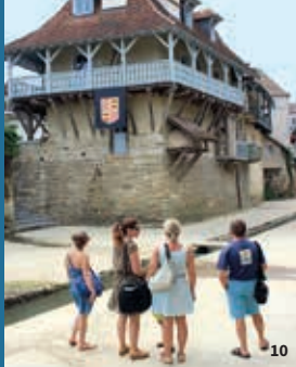
11. Néo Noé Sauveterre-de-Béarn