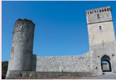
Forteresse de Bellocq XIII e siècle