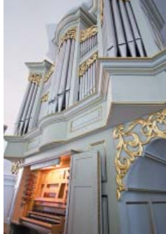
Orgues baroques du temple d'Orthez XX e siècle