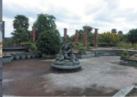
Bassin à l'antique du Château Bijou XX e siècle Labastide-Villefranche