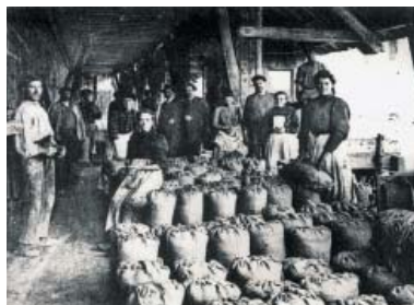
Salines de Salies-de-Béarn au XIX e siècle